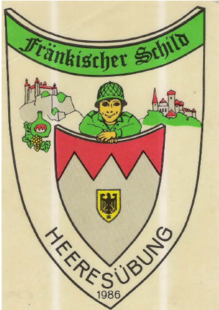
Das Logo der Heeresübung 1986 „FRÄNKISCHER SCHILD“

Am 07. Juni 1986 feierte das Bataillon seinen 20. Geburtstag im Rahmen eines Eltern und Angehörigen Besuchstages in der Falckensteinkaserne. Die Kompanien hatten ein volles Programm organisiert mit Musik Truppschau, eine Schau „Aufbau eines Fm Knoten“ im T-Bereich, sowie allerlei Spaßveranstaltungen für Groß und Klein.