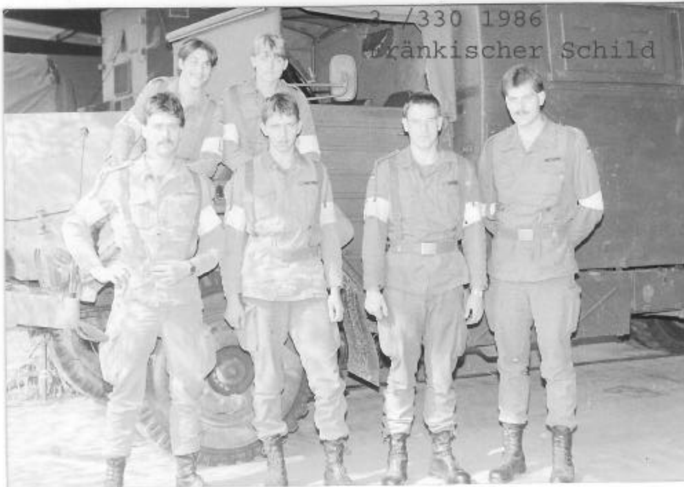
Die Schaltstelle der 3./FmBtl 330 in Kilsheim am Korpsgefechtsstand Haupt.