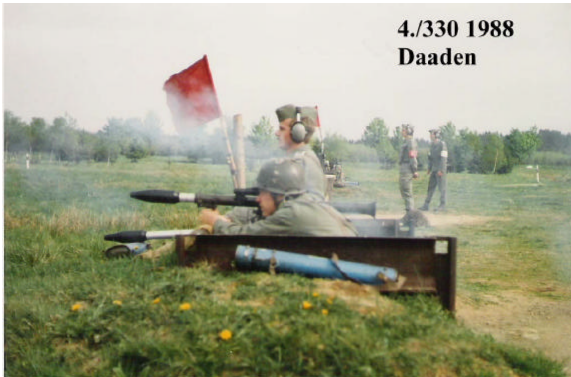
Panzerfaustschießen auf der Schießbahn 4 Truppenübungsplatz Daaden

15. – 20. Mai 1988 Truppenübungsplatz Aufenthalt in DAADEN unter der Teilnahme einer Delegation des 32th US Signal Bataillons.