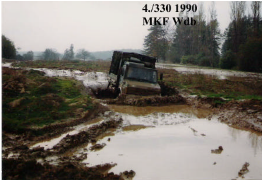
Wie man sieht schafft dies auch der Unimog 2 to Trägerfahrzeug der Richtfunk Kabine FmB I