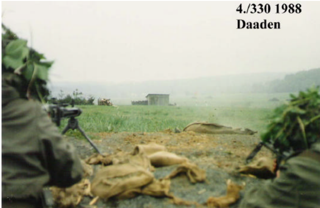
Gefechtsschießen auf der Schießbahn 5 Stellungssystem in Daaden hier mit MG 3 und Gewehr G 3.