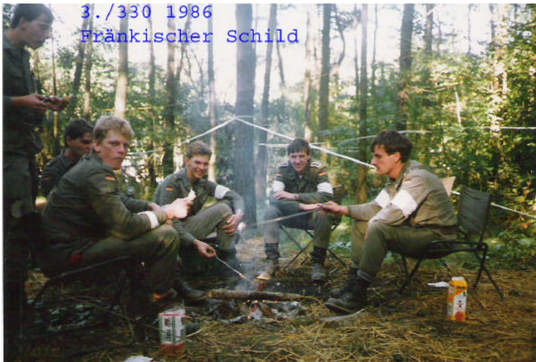
Lagerfeuer Romantik am Richtfunkaufbauplatz in Kilsheim 1986